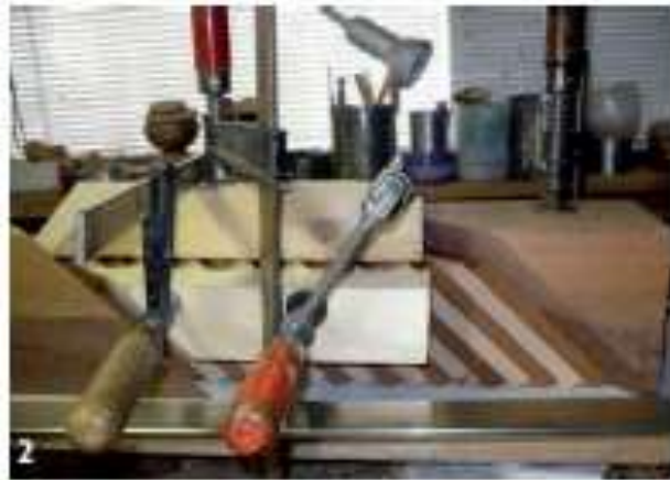
De lijnconstructie van beuken- en mahonie plankjes.