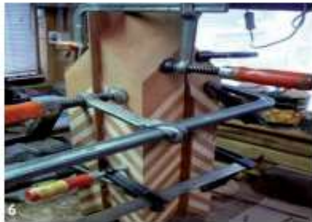
De vier delen worden aan elkaar gelijmd