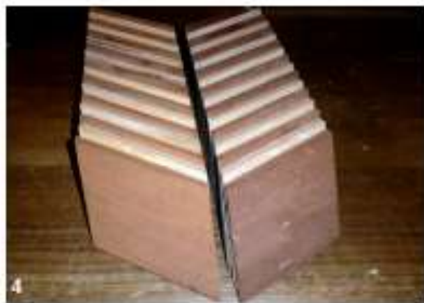
De binnenkant vlak en haaks maken met behulp van een vlakbank, de buitenkant op maat zagen met een cirkelzaag.