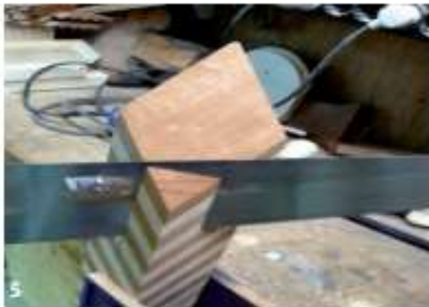
De binnenhoek afzagen, makkelijk voor het uithollen en noodzakelijk voor een prop van 50 x 50 mm voor het center.