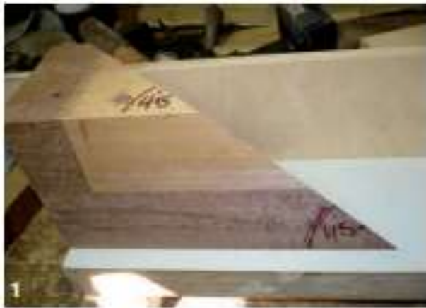
Dit hulpstuk / deze mal is onder 2 boeken van 45° gezaagd voor het lijmp proces.