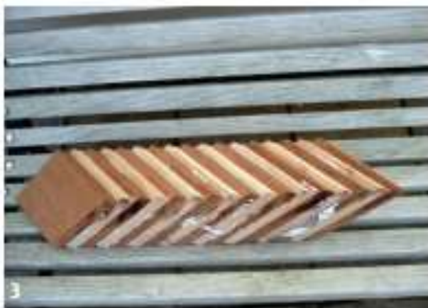
Eén van de vier delen gelijmd