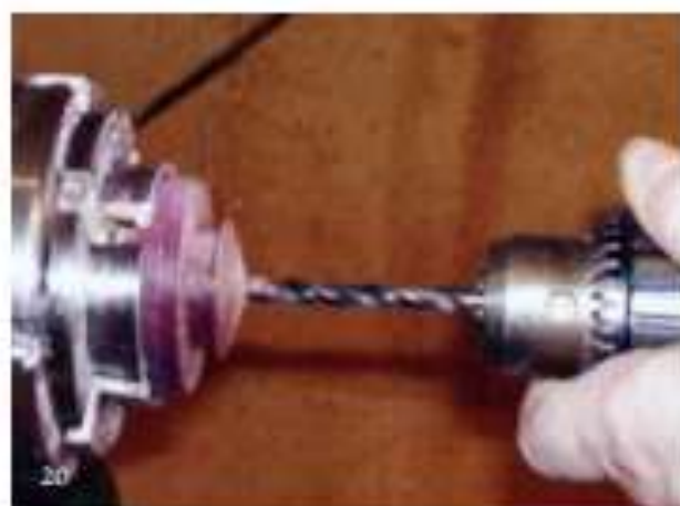
Foto 20 Boor een gaatje van 6 mm in het center van de contrastring. Dit is voor de steel van de drinkbeker.