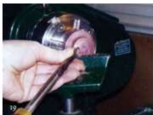
Foto 19 Draai de contrastring die op de voet van de drinkbeker komt. Maak die enigszins koepelvormig.