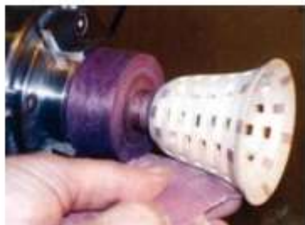
Foto 16 Schuur de buitenkant van de drinkbeker te beginnen met korrelgrootte 120 en daarna met opvolgende fijnere korrels. Eindig met korrel 600.