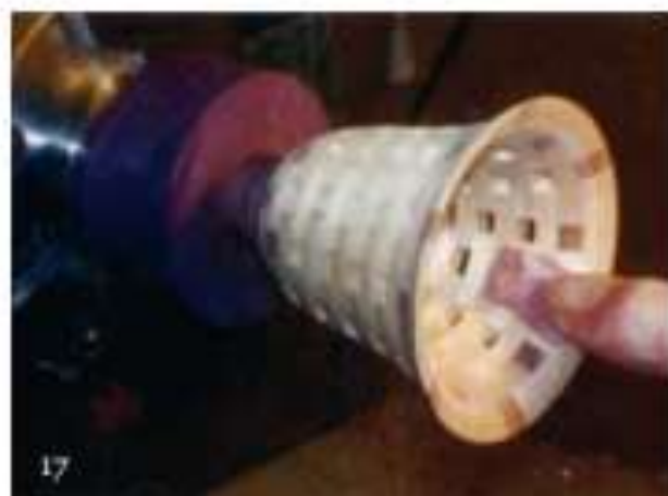
Foto 17 Schuur de binnenkant van de drinkbeker met dezelfde korrelgrootte als de buitenzijde. Houdt het schuurpapier op de 5 uur positie wat een vermindering geeft van afbramen bij de segmentopeningen.